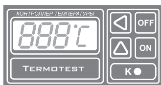
Рис.1 Передняя панель прибора.

Система автоматически определяет подключен датчик к прибору или нет, а также обрыв или короткое замыкание в датчике или соединительных проводах. В этом случае на индикаторе появляются три черточки по середине (- - -) и блокируется работа коммутирующего элемента (реле). Аналогичная ситуация возникает если температура датчика опускается ниже минус 60 °С или повышается выше 250 °С.