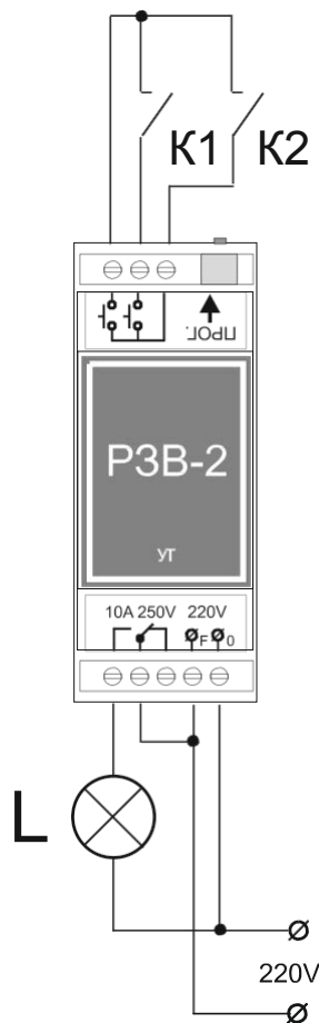
Рис 2. При замыкании контакта К1 или К2 лампа Л включается, после размыкания начинается отсчет времени по истечении которого лампа выключается. В качестве К может быть кнопка без фиксации или обычный выключатель. Применяется если необходимо управлять нагрузкой с двух разных мест.